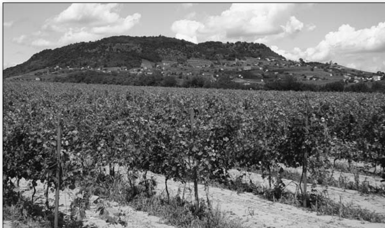
„Minden borunk közül a somlai számomra a nincs tovább.” Szőlőültetvény a Somló lábánál

szenvédélyes szerelemhez csak szekszárdit ajánlott; amikor nem tudta volna „elképzelni, hogy huzamosabb ideig minden nap hegyaljai igyak, bár nem tartom magam hétköznapi embernek”; amikor képtelen volt dönteni a badacsonyi és a szentgyörgyhegyi között – „végül is mi akadályozhat meg abban, hogy görög is legyek, meg kínai is?” –; amikor a somlait nevezte az egyetlen egyetememes bornak.