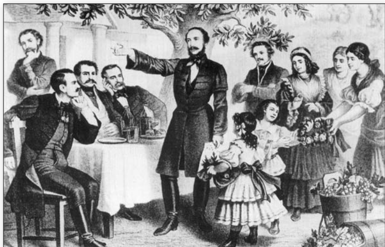
Vörösmarty Mihály verset szaval egy szüreti ünnepen Fóton (rajz az 1820–30-as évekből)

Már megint komoly vagyok. Csak most, a végén jövök rá, mi a gond. A bor filozófiájában annyi az idézhető mondat és gondolat, mint réten a fűszál, mint égen a csillag, mint falun a villanyfény. De ha kiveszek bármit a kontextusból, önálló életre kel. Ha megszűnik a szövegekörnyezet, új értelmet nyer az, aminek az eredeti értelme értelmesebb volt. Itt hibáznak azok, akik idéznek, és azok is, akik a lényegét idézetek alapján próbálják kikövetkeztetni, összerakni. Itt hibázok én is. Mi más tethetnék? Az egész könyvet nem másolhat- tam ide, nem fértem volna bele a húszezer karakterbe.