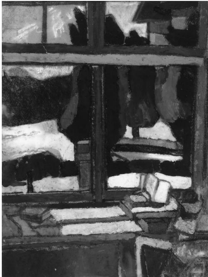
Gruber Béla: A sanatórium szobaablaka , 1963

– Hogyan ítéli meg a szentendrei művészet későbbi fejlődését?