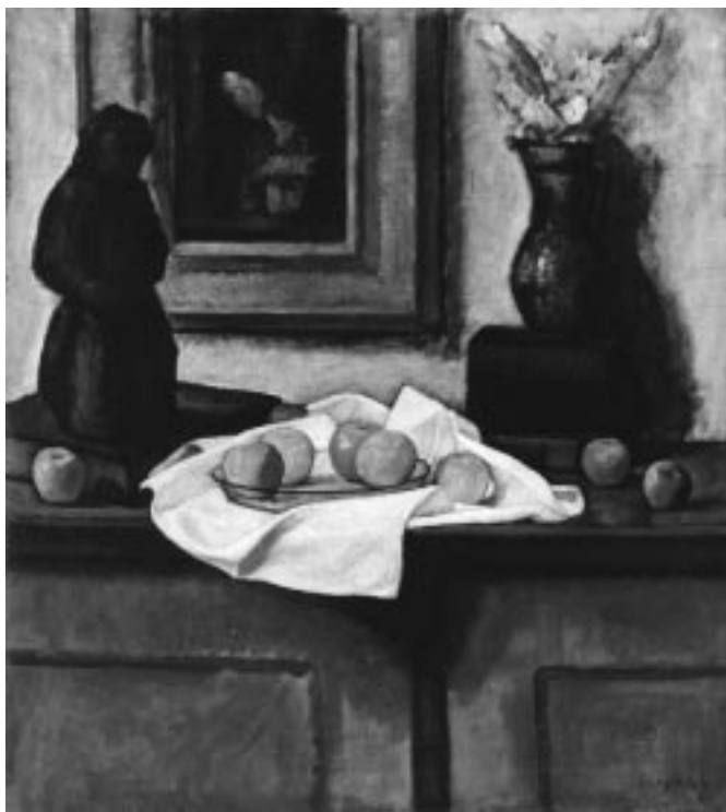
Czigány Dezső: Csendélet , 1910-es évek

– Milyen anyagi értéke volt ekkor a műveknek?