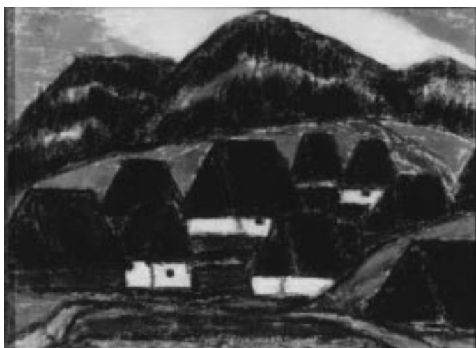
Nagy István: Erdélyi falu , 1923

harsány plakátjellegüket egy idő után már az ízlésemtől távol esőnek éreztem. Ugyanígy lefutott a Vaszary iránti érdeklődésem is, holott a korábban nálam lévő, Parkban című képe főmű. A gyűjtés tanulási folyamat, s ezt utólag sem szabad tagadni.