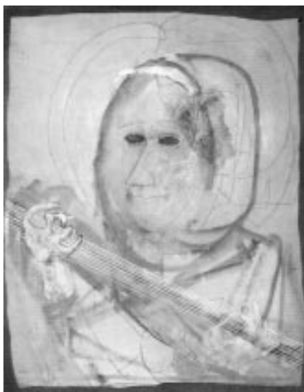
Kondor Béla: Gitaros nő , 1967

– Kondor Béla két műve Várkonyi Zoltán, a jeles filmrendező és színigazgató gyűjteményében szerepelt, s halála után, Szemere Verától került hozzám. Máig sajnálom, hogy nem mondtam viszont Kondor diptichonjára, a Hieronimus Bosch műve ihlette A pokol tornácán című képre. Ez Köves Oszkár második gyűjteményének díszjele volt. Köves első nagy gyűjteményét Magyarországon hagyta, amikor az Egyesült Államokba távozott, ahová csak mintegy tucat Czóbel-képet vihetett magával. Amikor ezek értékét felél-