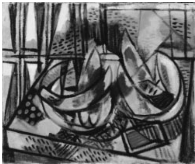
Gadányi Jenő: Dinnyés csendélet , 1954

ja, ez a női portré szerepelt a Károlyi Mihály akkori párizsi nagykövetségünk által az 1947-es brüsszeli nagy kiállításra válogatott tíz magyar kép között. Károlyi egyébként tudott akkor már Gerlóczy Gedeonról, aki megmentette Csontváry képeinek javát, s így Brüsszelbe kölcsön is kért négy Csontváry-képet, ezek társaságában szerepelt ez a Koszta. Tanulságos adalék a magyar művészet nyugat-európai befogadásához, hogy a brüsszeli kiállításon a Koszta-képet nagyobb érdeklődéssel nézték a Csontváry-vásznaknál. A nyugati közönség „magyaros” képeket keresett. S ez a Koszta eközben egy igen érzékeny, finom színhatású arckép is.