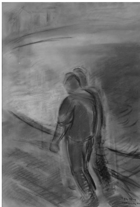
Egyri József: Vízparton , 1942

– Milyen művek jutottak így a gyűjteményébe?