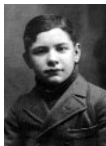
A költő igazolványképe 1920-ból

nyolcvan fokok fordulat és Kassák Lajos következett. József Attila a nyolcvanas években került a figyelmem központjába. A Kossuth Klubban volt egy ünnepi megemlékezés a költő nyolcvanadik születésnapja alkalmából, melyen engem is kiültek a méltatók asztalához. Beszédemben többek között azt találtam mondani, hogy nagyon rosszat tett neki a kommunista párthoz fűződő egyoldalú szerelme, valamint azt követeltem, adják ki a Szabad-ötletek jegyzékét . * A megjegyzéseim akkora felhörtülést keltettek a pártközpont és a hivatalos irodalom megjelent képviselői körében, akik ott helyben, ünnepi megemlékezéshez méltatlan és kioktató hangnemben határolták el magukat tőlem, és utasították vissza mindkét felvetést, hogy erősen el kellett gondolkodjam azon, hogyan képes valaki még mindig ekkora indulatokat kiváltani az utókorból. Egyszerre kíváncsi lettem arra, ki is ő valójában . Ráadásul akkoriban tanítottam, s arra gondoltam, alaposan és hitelesen kéne tanítani ezt a valóban figyelemreméltó szerzőt. Nekiláttam hát az életmű alaposabb tanulmányozásának, s rádöbbsentem, hogy valóban kiváló alkotó.