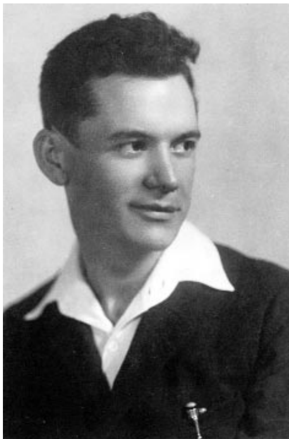
József Attila fényképe A Hét 1928. május 4-i számában

vét tanulmányozó irodalomtörténészek ellenségesen állnak szemben egymással. A tudomány köztársaság, amelyben bárkinek lehet igaza, és bárki – lényeges kockázat nélkül – tévedhet. Ám egyes kutatók az igazság birtoklásának igényével léptek föl, és ócsárolták a többieket. Ennek a magatartásnak nincs helye a tudomány intézményében.