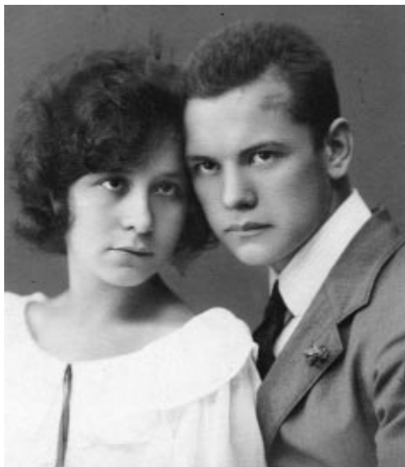
Etelkával Makón, 1923-ban.

– Van-e létjogosultsága azoknak a köteteknek, melyek a személyiségkép- pel, illetve a patológiával foglalkoznak?